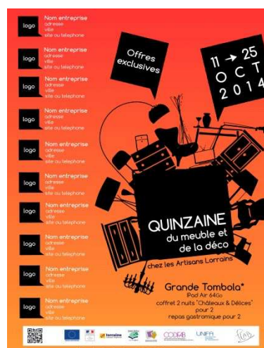
Page publicitaire :